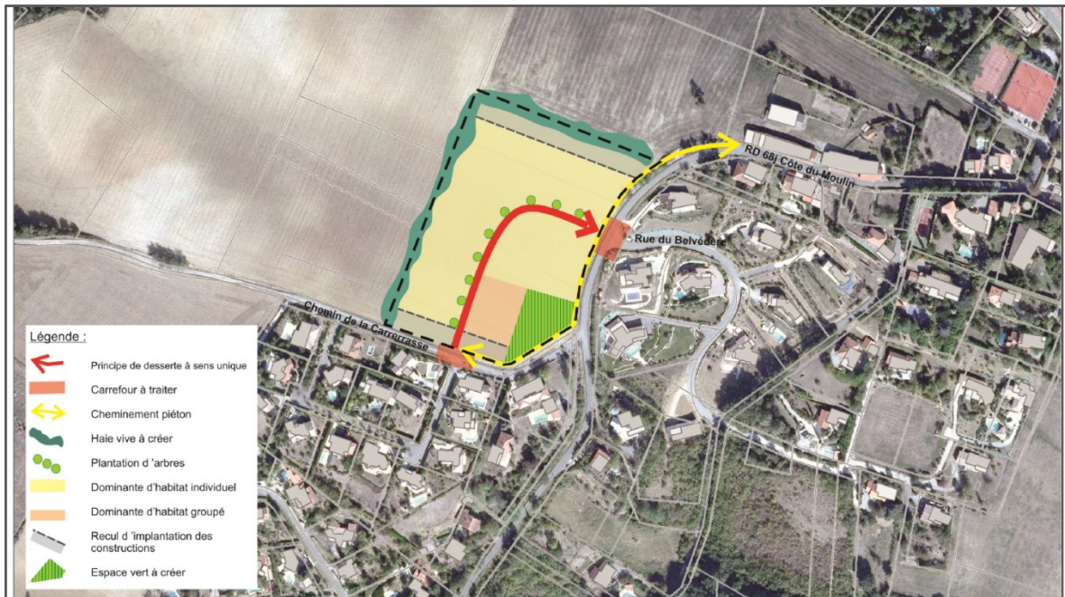
Extrait du schéma de l'OAP définie sur le secteur Carrerrasse

Le secteur est couvert par une Orientation d'Aménagement et de Programmation , qui veille notamment à assurer une intégration qualitative des futures constructions. Le site bénéficie de points de vue remarquables sur la plaine de la Garonne et de l'Ariège du fait de sa situation sur la commune, positionné sur le coteau.