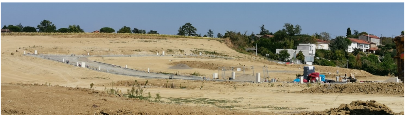
Aménagement en cours du secteur avec réalisation de la voirie en cœur d'opération – Septembre 2020

Aucune de ces orientations et de ces objectifs ne sont remis en question par la présente modification simplifiée du document d'urbanisme.