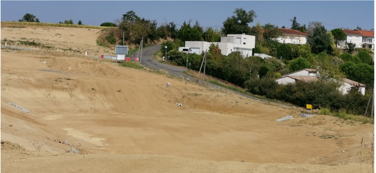
Prise de vue du bassin de rétention, trouvant sa place au croisement entre le chemin de Carrerrasse et celui de la Côte du Moulin – Septembre 2020