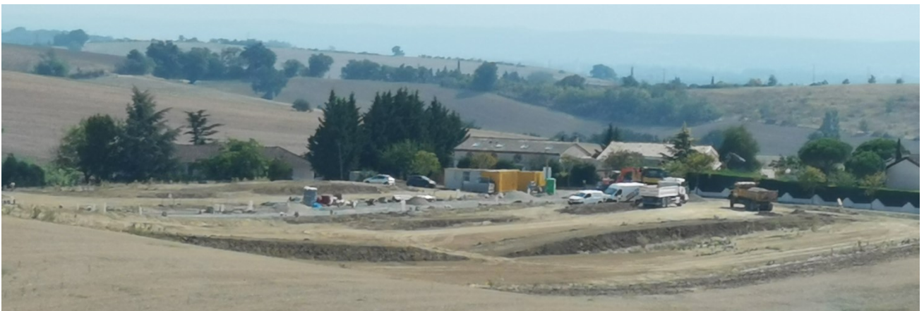
Le chantier en cours, vu depuis le chemin des Crêtes – Spetembre 2020 / Sicoval