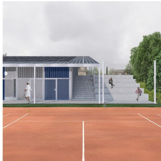
vue depuis un terrain de tennis