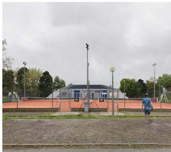
vue depuis le parking du club de tennis