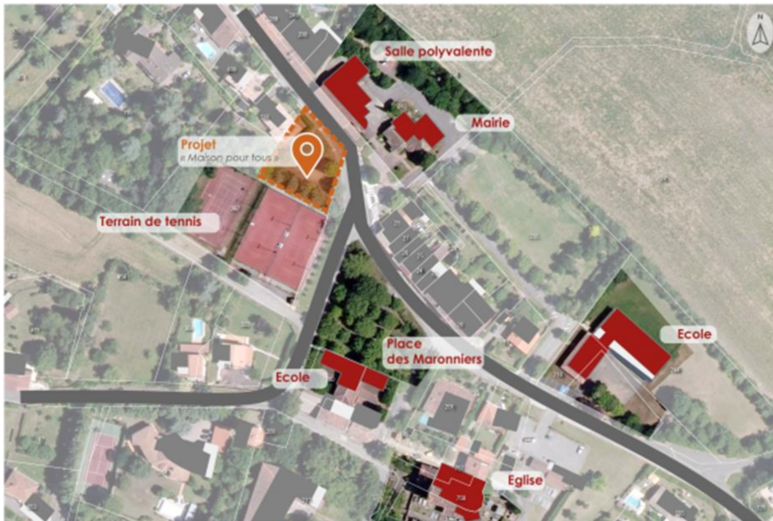
Commune de Goyrans / Localisation du projet dans le village