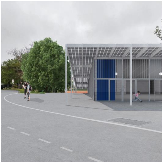
vue depuis l'espace public de la mairie