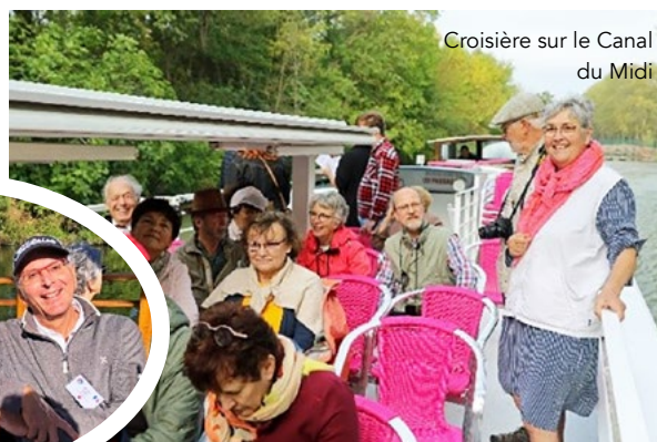
Croisière sur le Canal du Midi

Du 16 au 23 septembre : Accueil de 11 « ambassadeurs » américains originaires de la ville de SHELBY (Caroline du Sud). Ils ont pu découvrir Toulouse, Albi avec une croisière en gabare sur le Tarn depuis le port de plaisance d'Aiguelèze, le château de Bonrepos (Paul Riquet) et Carcassonne. Le groupe est reparti le 23 septembre avec pleins de bons souvenirs en tête.